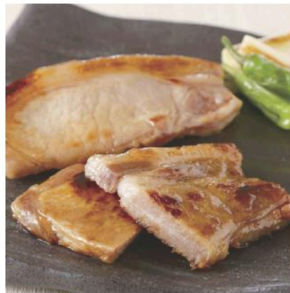
島根県産豚ロース粕漬 匠熟豚5枚入