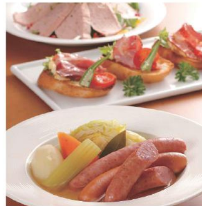
DLGコンテスト受賞ケンボローハムセット